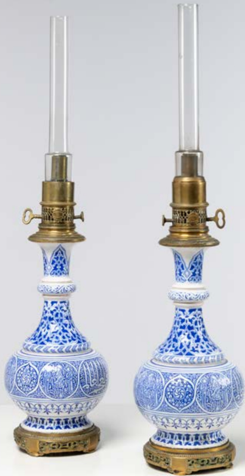
117. Théodore DECK (1823-1891) Paire de lampes de forme balustre en céramique émaillée blanche et bleue à décor d'Iznik, base en bronze doré à décor ajouré. Monogrammées Monture marquée Gaigneau. Vers 1880-1890. H totale: 71 cm - H sans les verres : 52 cm (Joint deux globes en verres à godrons) 1 500 / 2 000 €