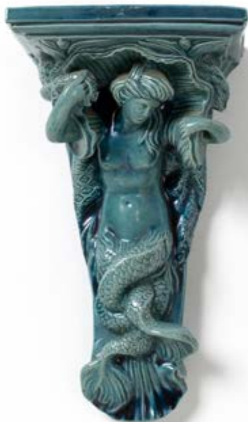
140. Paire d'appliques Neptune et Amphitrite Faïence émaillée XXeme siecle H 30 x L 17 x P 15 cm 300 / 400 €