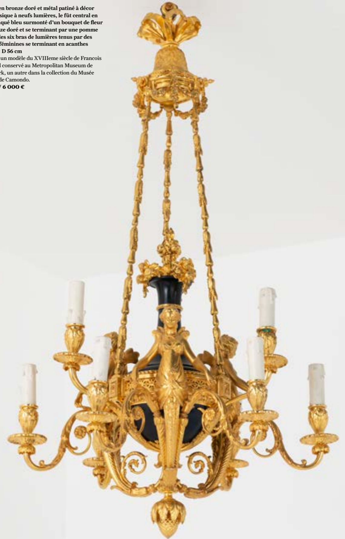
130. Lustre en bronze doré et métal patiné à décor néoclassique à neuf lumières, le fût central en métal laqué bleu surmonté d'un bouquet de fleur en bronze doré et se terminant par une pomme de pin, les six bras de lumières tenus par des figures féminines se terminant en acanthes H 100 x D 56 cm D'après un modèle du XVIIIème siècle de Francois Remond conservé au Metropolitan Museum de New York, un autre dans la collection du Musée Nissim de Camondo. 4 000 / 6 000 €