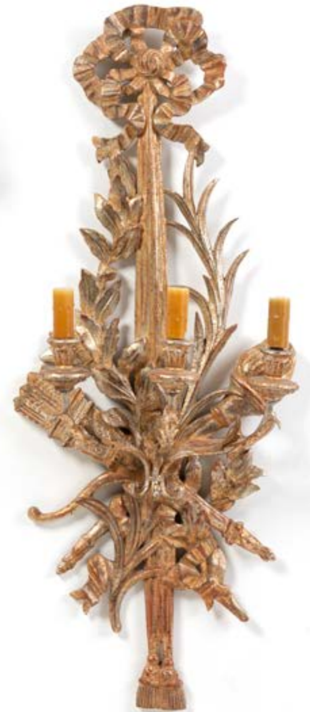
72. Paire d'appliques au trophées de carquois et chûtes de noeuds de rubans en bois doré et sculpté à trois lumières et branchages en métal doré Style Louis XVI - probablement Jansen H 100 cm Bon état général, électrifiées. 600 / 900 €