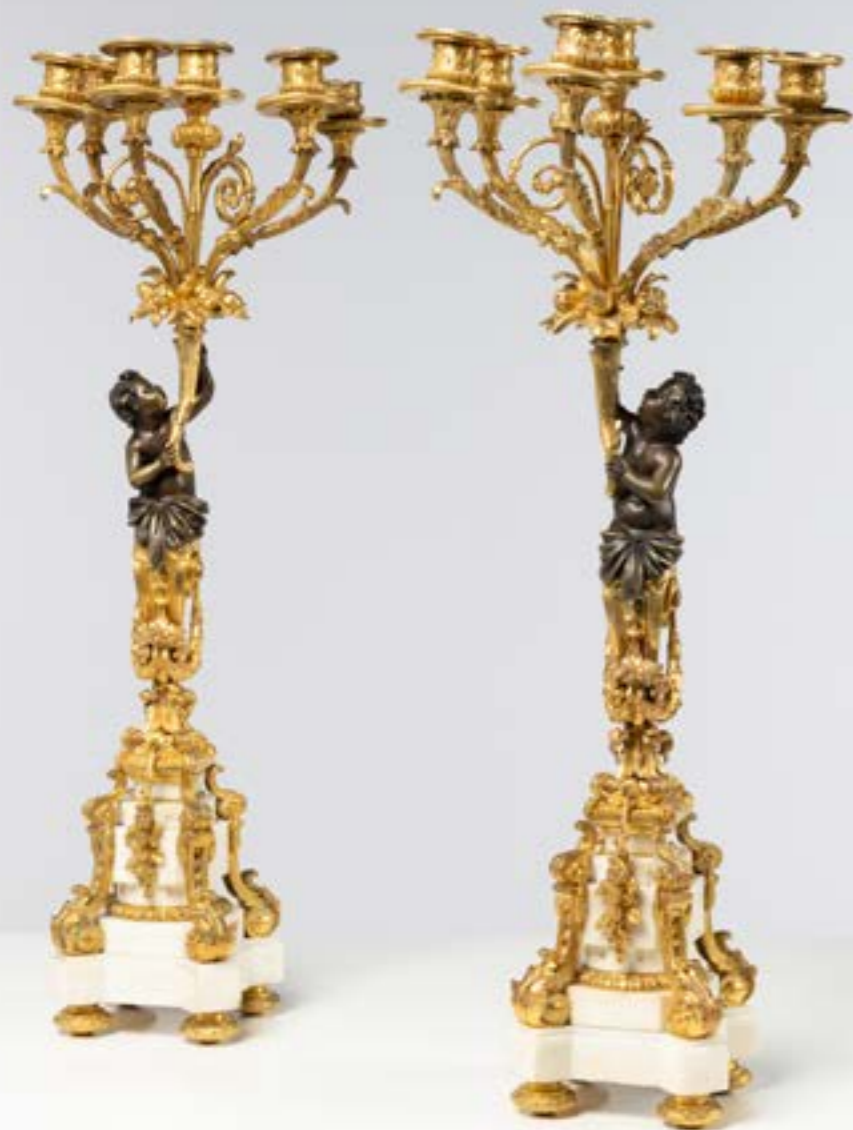
83. Paire de candélabres aux enfants en bronze patiné et bronze doré à six bras de lumières, reposant sur une base en marbre blanc et console de bronze doré ; Epoque Napoléon III. H 68 x L 27 x P 15 cm (petites restaurations, fente au marbre sur une base, un élément de décor non fixé. Un pied non fixé). 1 000 / 2 000 €