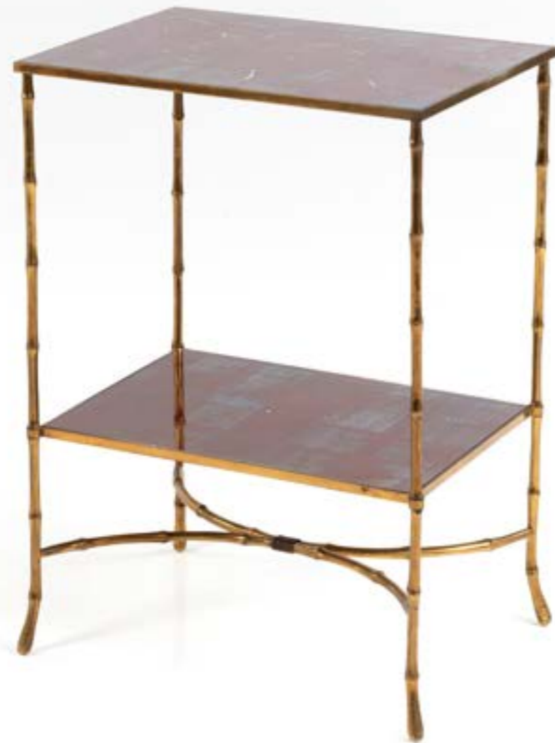
Table d'appoint en métal laqué à deux tablettes Montant en bronze doré à l'imitation du bambou XXème siècle H 70 x L 35 x L 50 cm (traces d'oxydation et griffures sur les plateaux) 200 / 300 €