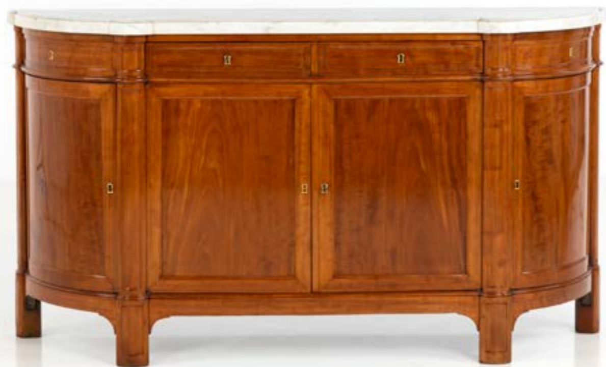
129. Buffet demi-lune en acajou mouluré ouvrant à quatre vantaux et deux tiroirs, le dessus de marbre blanc reposant sur des montants arrondis terminés par des pieds découpés. Estampille de Jean-Antoine Bruns, ébéniste reçu maître en 1782. Epoque Louis XVI H 104 x L 189 x P 42 cm 1 200 / 1 600 €