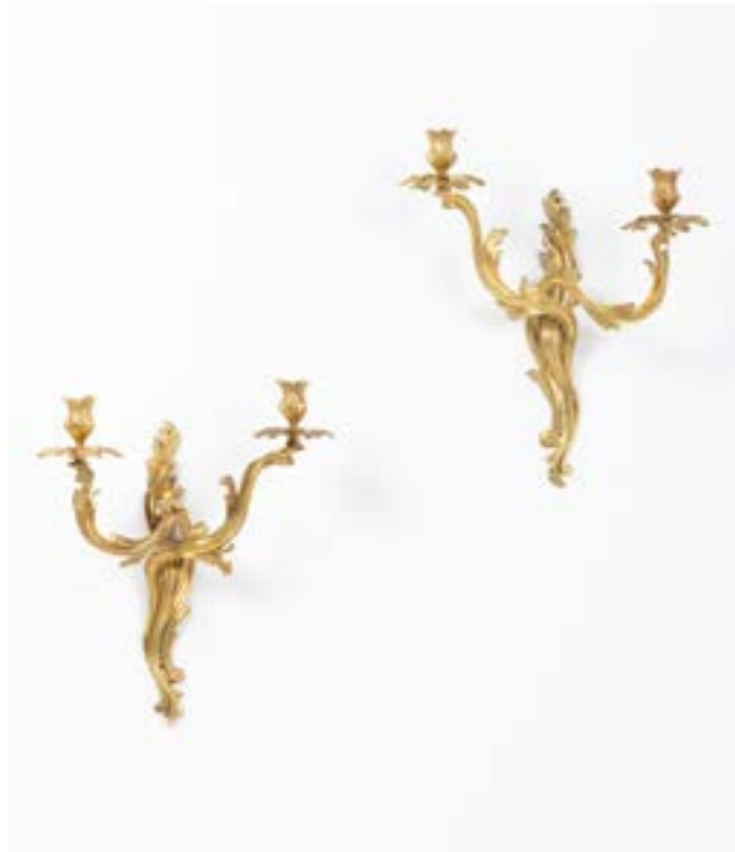
97. Paire de bras de lumière en bronze doré à deux branches, à décor de feuillages ; (dorure d'époque postérieure ; percées pour l'électricité). Milieu du XVIIIe siècle. H 47 x L 38 cm (percée pour l'électricité) 500 / 700 €